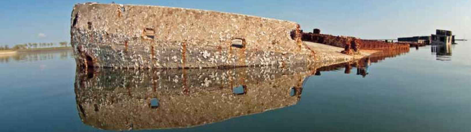
Le Serpent op zijn oude rustplaats in de Schelphoek.

zoekt momenteel de mogelijkheden om alsnog een schip op het stenen bed af te zinken. Hopelijk wordt een wrak op geringe diepte alsnog gerealiseerd.